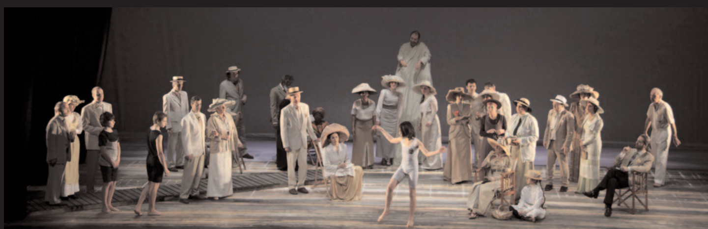
En 20121, Samson et Dalila