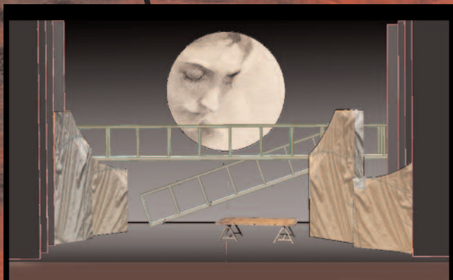
Acte I, L'échaffaudage de la chapelle