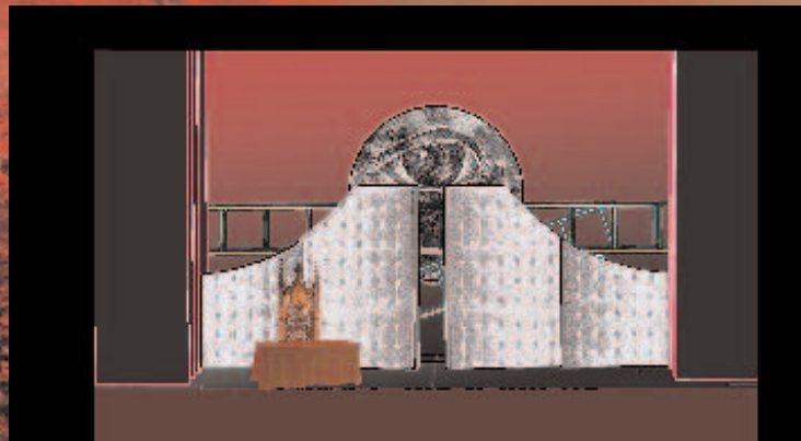
Acte II, Le bureau de Scarpia