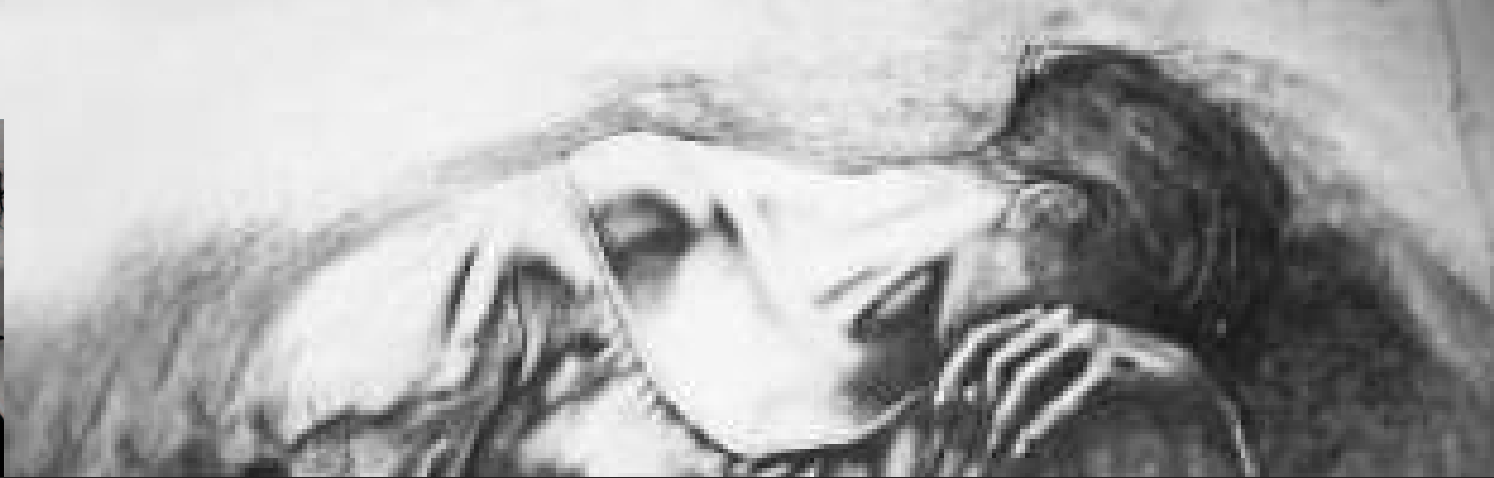
Fabienne Conrad - Tosca